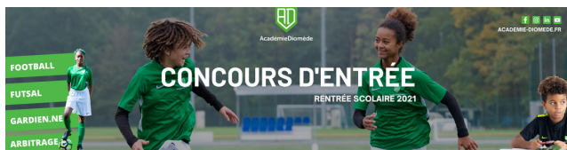
L'éducation par le football avec l'Académie Diomède : 37 200 € alloués en 2021 pour soutenir ce projet.