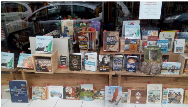
Le développement de l'Offre Culturelle et Educative dans le cadre des Quartiers d'Été avec l'association APTIMOTS