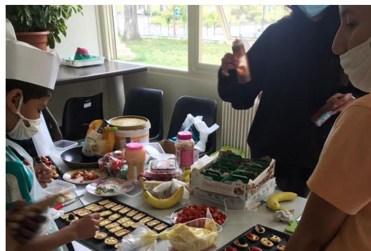
Ateliers culinaires organisés par l'association SALADES 2 MATHS : APPRENDRE EN CUISINANT