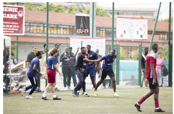
La mobilisation des jeunes de l'association FAIS TA TEAM autour des priorités entre médiation-prévention par le sport, la continuité sportive et éducative pour les enfants et les jeunes inoccupés