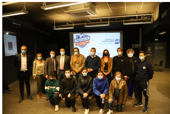
La Roustan Academy : 6 000 euros du budget annuel de la cité éducative alloués à ce projet permettant à une quinzaine de jeunes passionnés de football de participer à des ateliers sur l'histoire du ballon rond et le métier de commentateur sportif