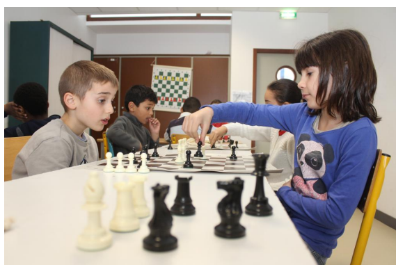
Initiation des jeunes à la pratique des échecs