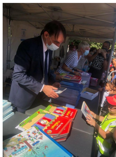
Opération 1000 Livres en partenariat avec l'ANCT et l'association Biblionef